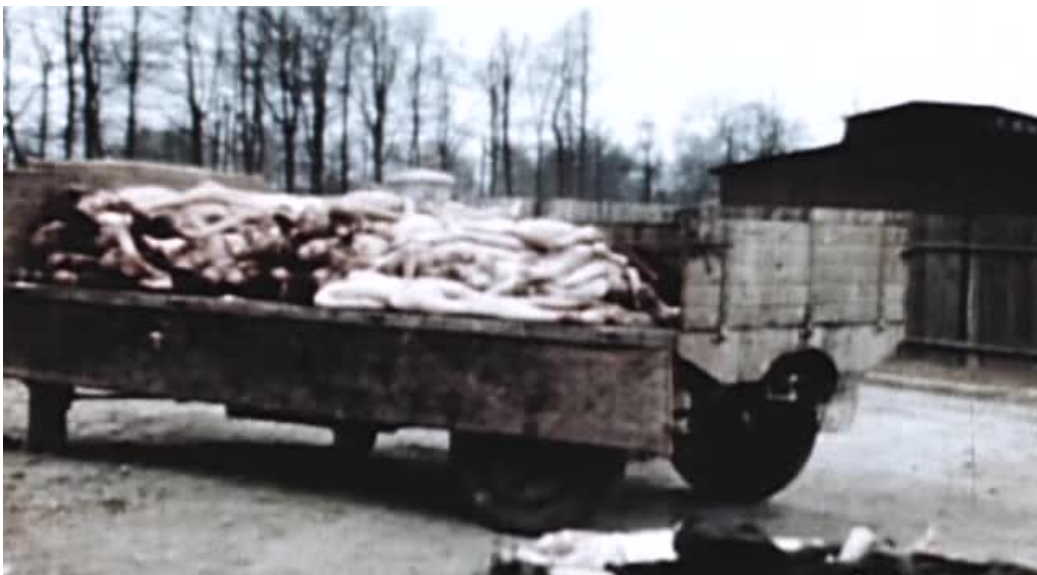
Imágenes 17 y 18: Auschwitz (UweBoll, 2011)

El discurso de Boll se levanta, como ya hemos dicho, en dos lenguas: el alemán y el inglés. Cada vez que el director cambia de lenguaje, se introduce uno de esos planos de archivo. Resulta interesante que toda la presentación se genere sobre esa incomodidad de la lengua, esa doblez del lenguaje en el que comparecen tanto el lenguaje en el que se perpetra el crimen (Klemperer, 2001) como el lenguaje hegemónico en el momento del rodaje. Lo que más nos interesa ahora, sin duda, es la extraña función de “separador” en la que Boll utiliza las imágenes de archivo. Hay