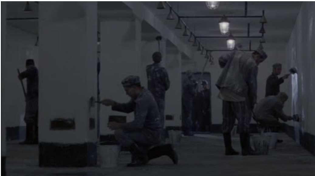
Imágenes 11 y 12: La zona gris (Tim Blake Nelson, 2001)

En primer lugar, la secuencia está completamente desgajada en términos narrativos. No comparece ningún protagonista, ni tiene lugar ningún acontecimiento que haga avanzar la acción. Antes bien, su significado es puramente descriptivo de cara al espectador: nos habla de un proceso , de la elaboración de un cierto trabajo. Los planos están conectados por una suerte de lógica apoyada en el tiempo: mientras se limpian las paredes (panorámica), arden los cadáveres (panorámica), y finalmente (salto de eje óptico) el habitáculo se prepara para una nueva recepción de futuras víctimas.