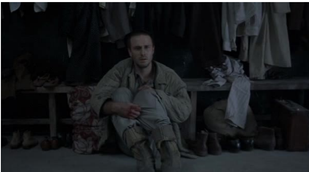
Imágenes 15 y 16: La zona gris (Tim Blake Nelson, 2001)