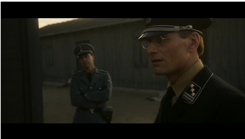
Imágenes 03 y 04: Good (Vicente Amorin, 2008)

Mortensen pronuncia entonces las dos últimas palabras de la película: Es real . Ahora bien, ¿qué es real ? ¿El delirio que atenazaba al personaje y que ahora se encarna en esos cuerpos que miran hacia él? ¿El sistema de exterminio, consecuencia última de sus teorías académicas que ahora se encarnan en la topografía del campo? O en el límite, ¿el propio sistema fílmico enunciativo, en el que no hay corte alguno sino que el tiempo –un tiempo del horror- fluye interminablemente dentro del plano?