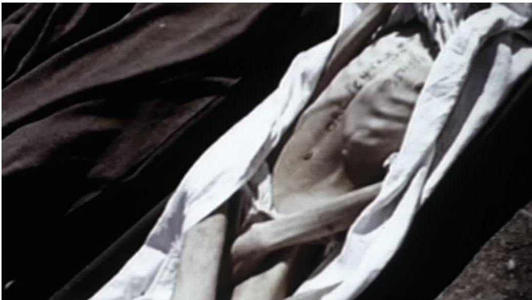
Imágenes 19 y 20: Auschwitz (UweBoll, 2011)