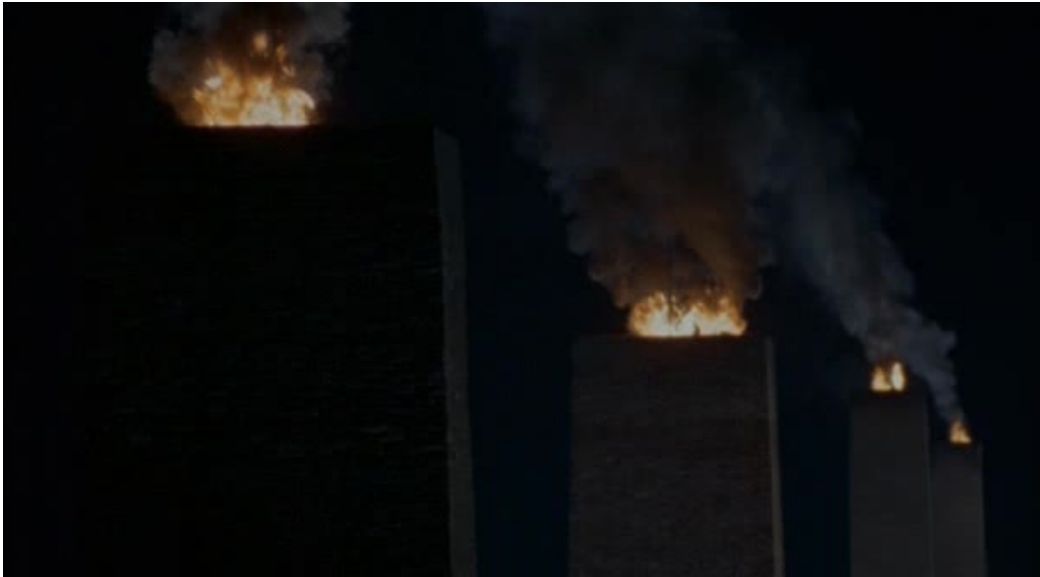
Imágenes 09 y 10: La zona gris (Tim Blake Nelson, 2001)

A continuación, regresamos de nuevo al interior de la cámara de gas. En esta ocasión, los sonderkommando pintan de blanco sus paredes ante la atenta mirada de un SS que fuma un cigarrillo al fondo de la escena. Se produce un salto sobre el eje óptico de alejamiento y el cuadro de los trabajadores se amplía considerablemente, generando una suerte de tableau macabro.