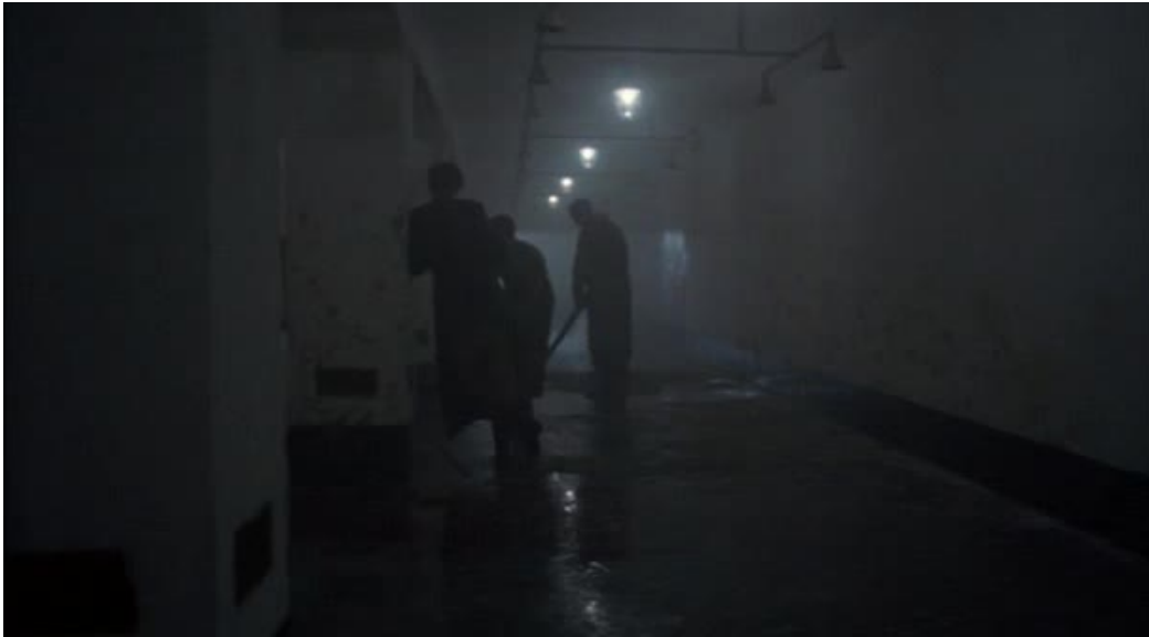
Imágenes 07 y 08: La zona gris (Tim Blake Nelson, 2001)

El corte en montaje se produce inmediatamente a continuación, con una panorámica descendente que acude a la contra del movimiento del humo que se alza hacia el cielo de Birkenau.