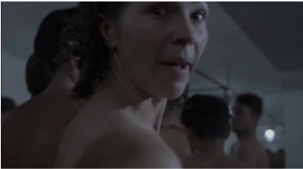
Imágenes 13 y 14: La zona gris (Tim Blake Nelson, 2001)

El montaje volverá a dejar de nuevo fuera del relato la mostración explícita de lo que ocurre con los cuerpos en el interior de la cámara. En su lugar, ofrece dos planos sustitutorios: un rápido inserto de la puerta al ser cerrada y una panorámica de acercamiento al cuerpo atormentado de Hoffman, utilizando únicamente el sonido para sugerir lo que ocurre en su interior: gritos, golpes sobre las paredes, y el constante zumbido de los crematorios filtrándose en el espacio.