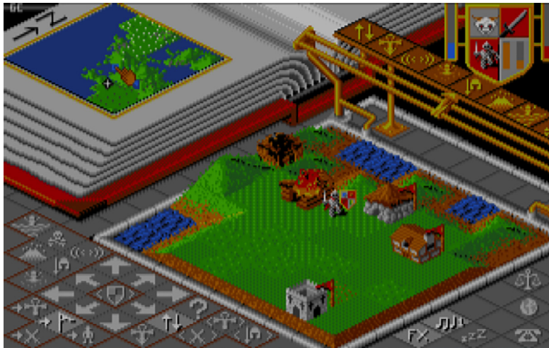
Figura 1: Pantalla de Populous

Lo segundo que merece la pena señalar está situado al propio nivel del interfaz del juego, en el nivel de los existentes . Pese a que la lógica de triunfo sea necesariamente finalista y pragmática, el juego se niega a abandonar las raíces míticas en su configuración textual.